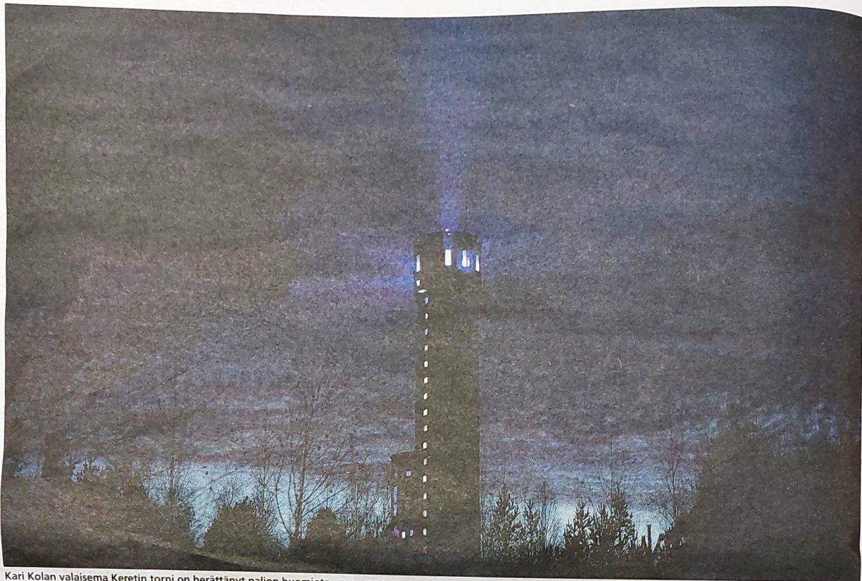
Kari Kolan valaisema Keretin torni on herättänyt paljon huomiota.