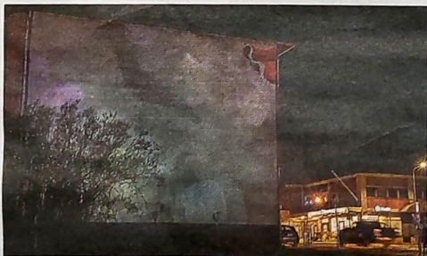
Kulttuuritalo Maritassa oli esillä valotaidetta.